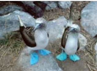
Sule dai piedi azzurri delle Galapagos

Museo Civico di Zoologia - Via Ulisse Aldrovandi, 18 - www.museodizooologia.it