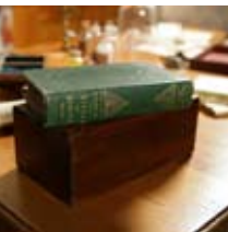
Particolare dello studio di Darwin a Down House