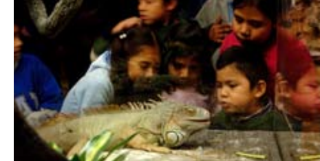
Esemplare vivo di iguana verde